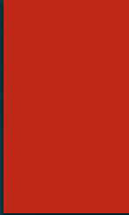
De 15 største grupper innvandrere og norskfødte med innvandrerforeldre i Norge. 1. januar 2012. Absolutte tall